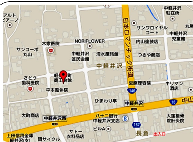
《軽井沢町商工会館》